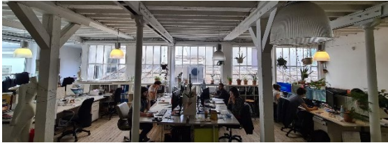
Agence, 42 rue Sedaine Paris XIème

Urbanwater, créée et dirigée par Christian Piel, est une agence spécialisée dans L'INTEGRATION DE L'EAU DANS LA VILLE, tant dans les domaines du RISQUE (inondation, ruissellement, cours d'eaux, submersion marine) que de la RESSOURCE (nature en ville, rafraîchissement bioclimatique, recyclage).