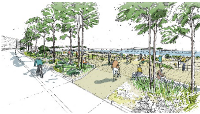
Aménagement du littoral face aux risques de submersion marine – Cayenne